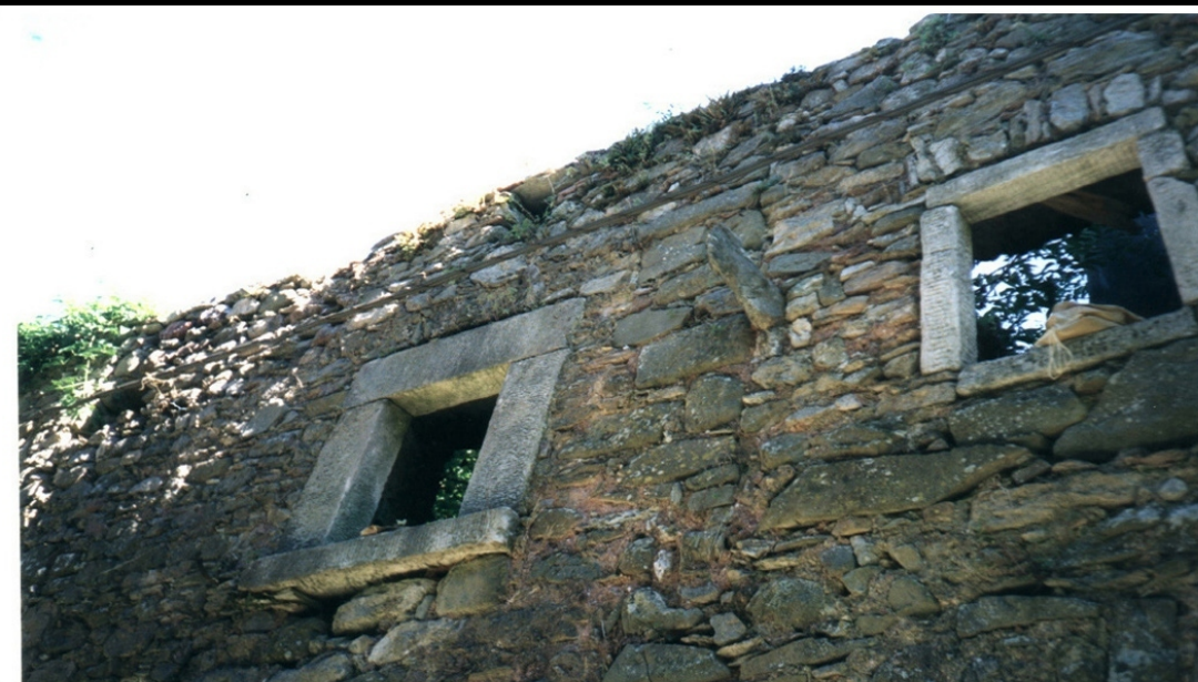
ESEMPIO DI RUDERE RECUPERABILE CATEG. A5