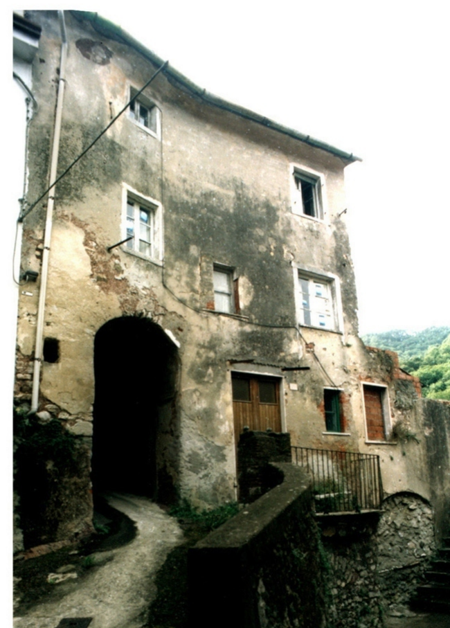
EDIFICIO PARTIC. 799 CATEG. A2