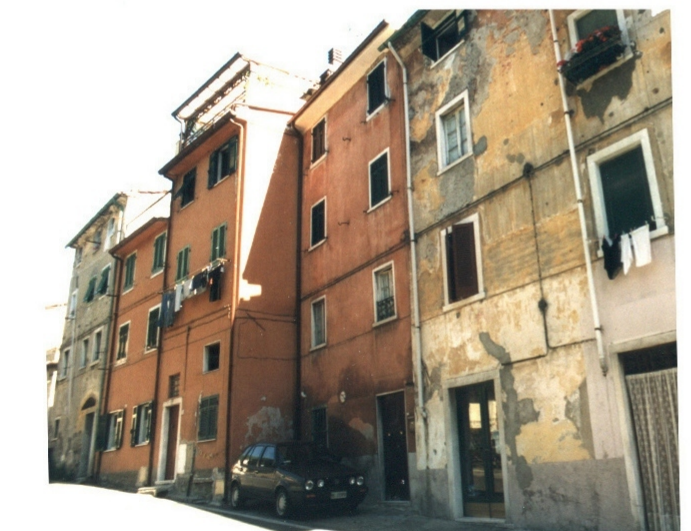
GRAGNANA PALAZZATA NORD EST CATEG. EDIFICI A2 A3 A4