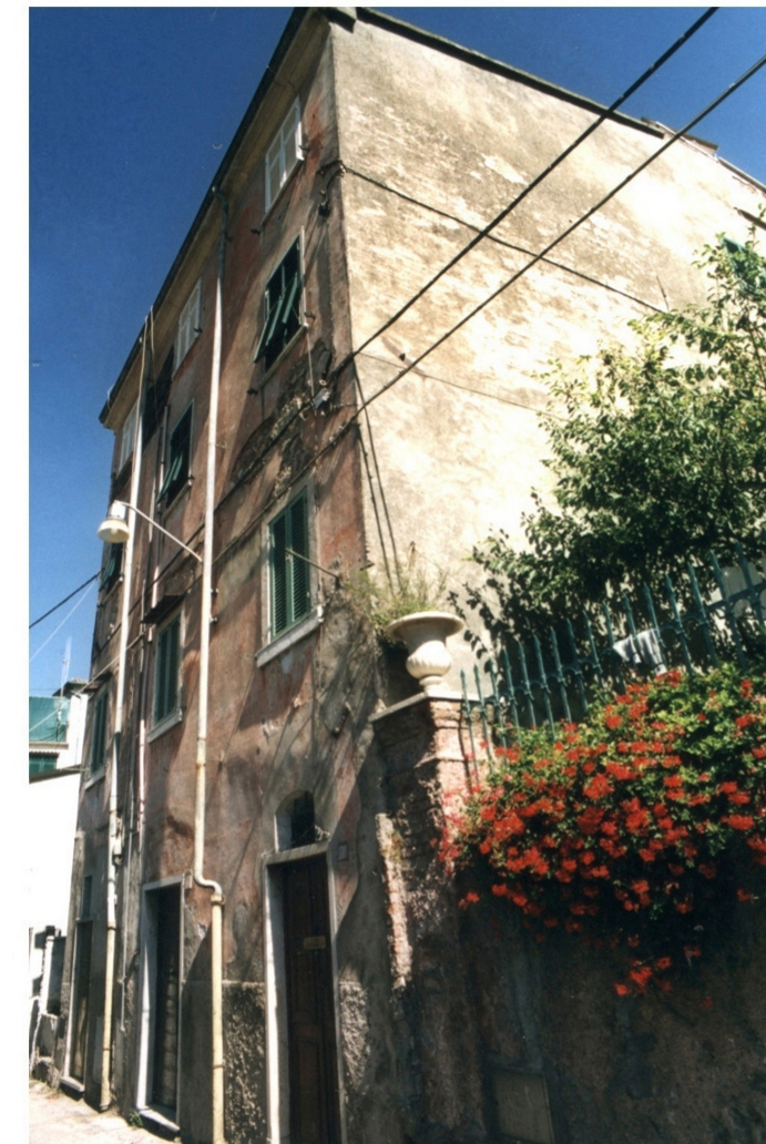
GIARDINO DELL'EDIFICIO 19A CATEG. A4 EDIFICIO ADIACENTE CATEGORIA A3