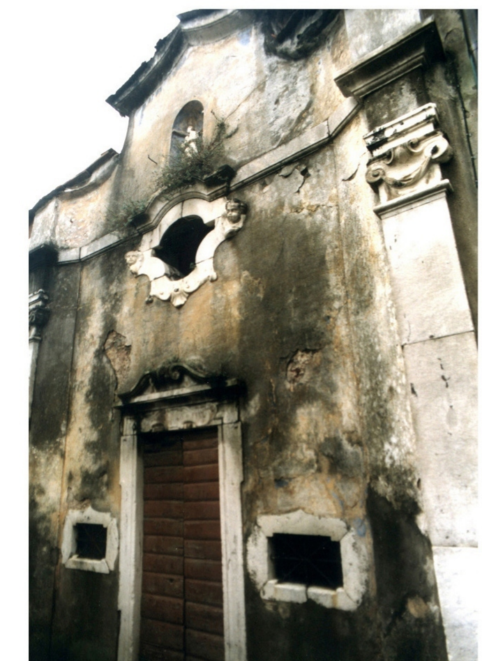
ORATORIO DEL 1700 CAT.A1