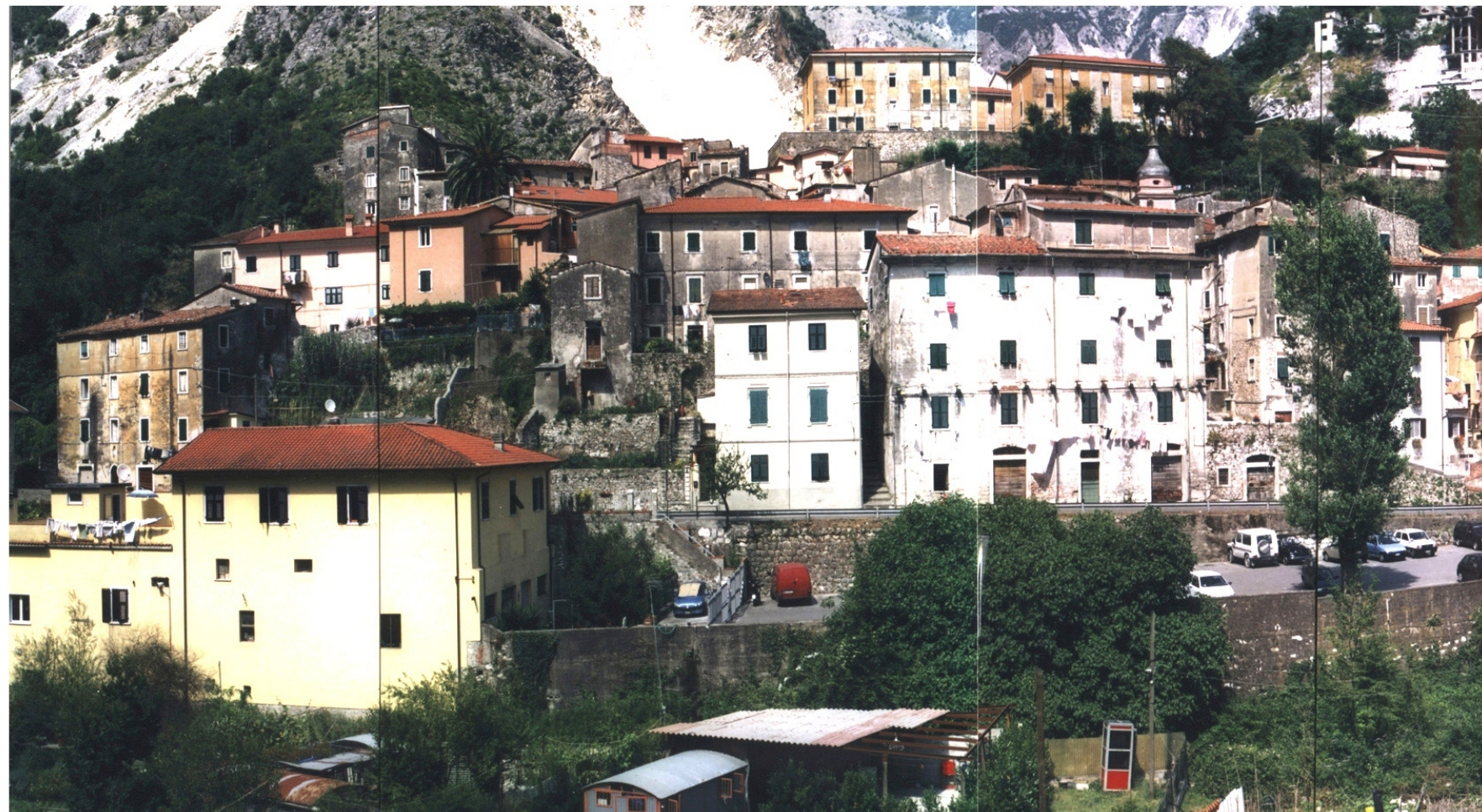
LA PALAZZATA OVEST DEL CENTRO STORICO DI TORANO