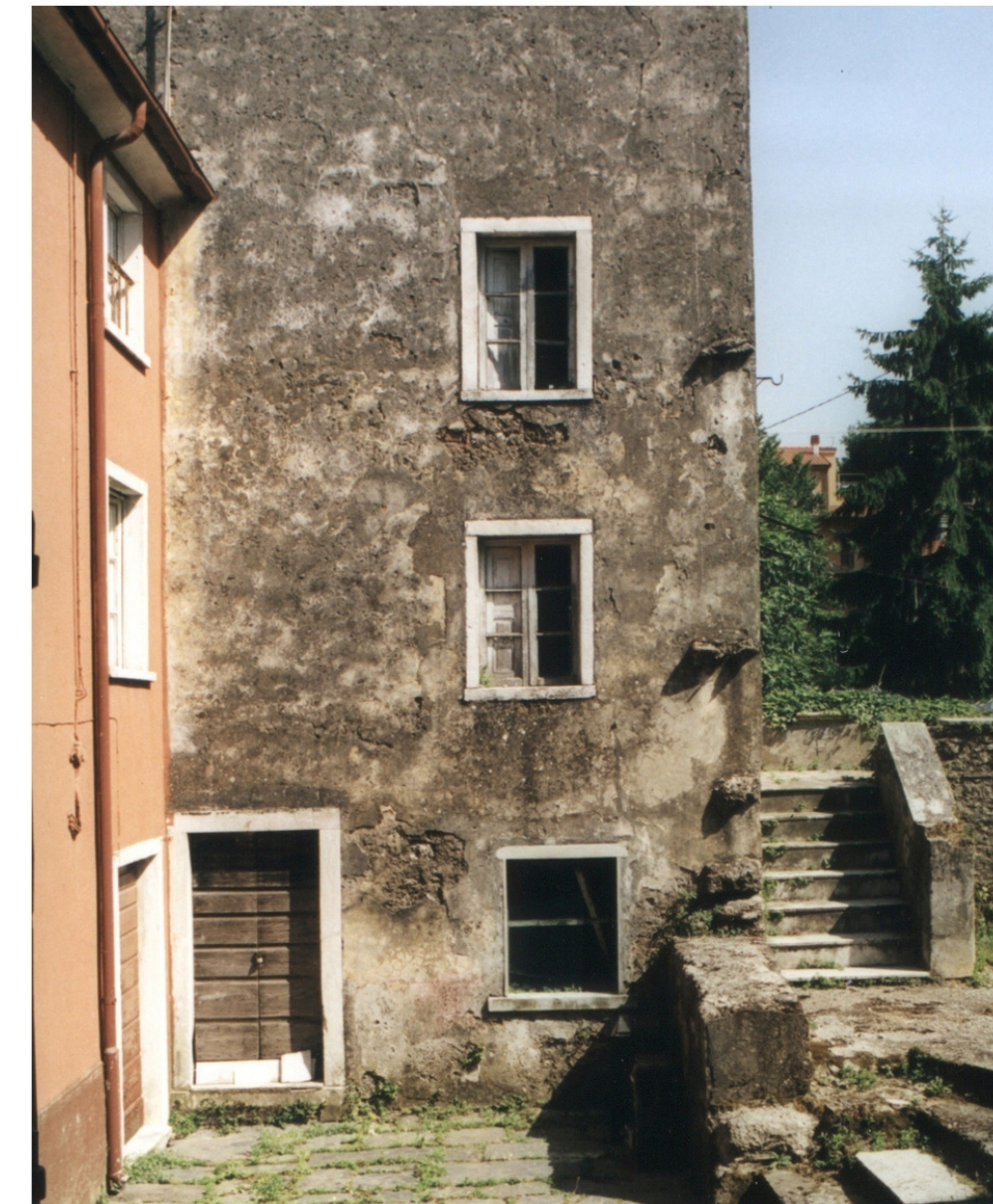
UNO DEI POCHISSIMI EDIFICI CHE NON HA SUBITO INTERVENTI (PARTIC. 99 PARZIALE)