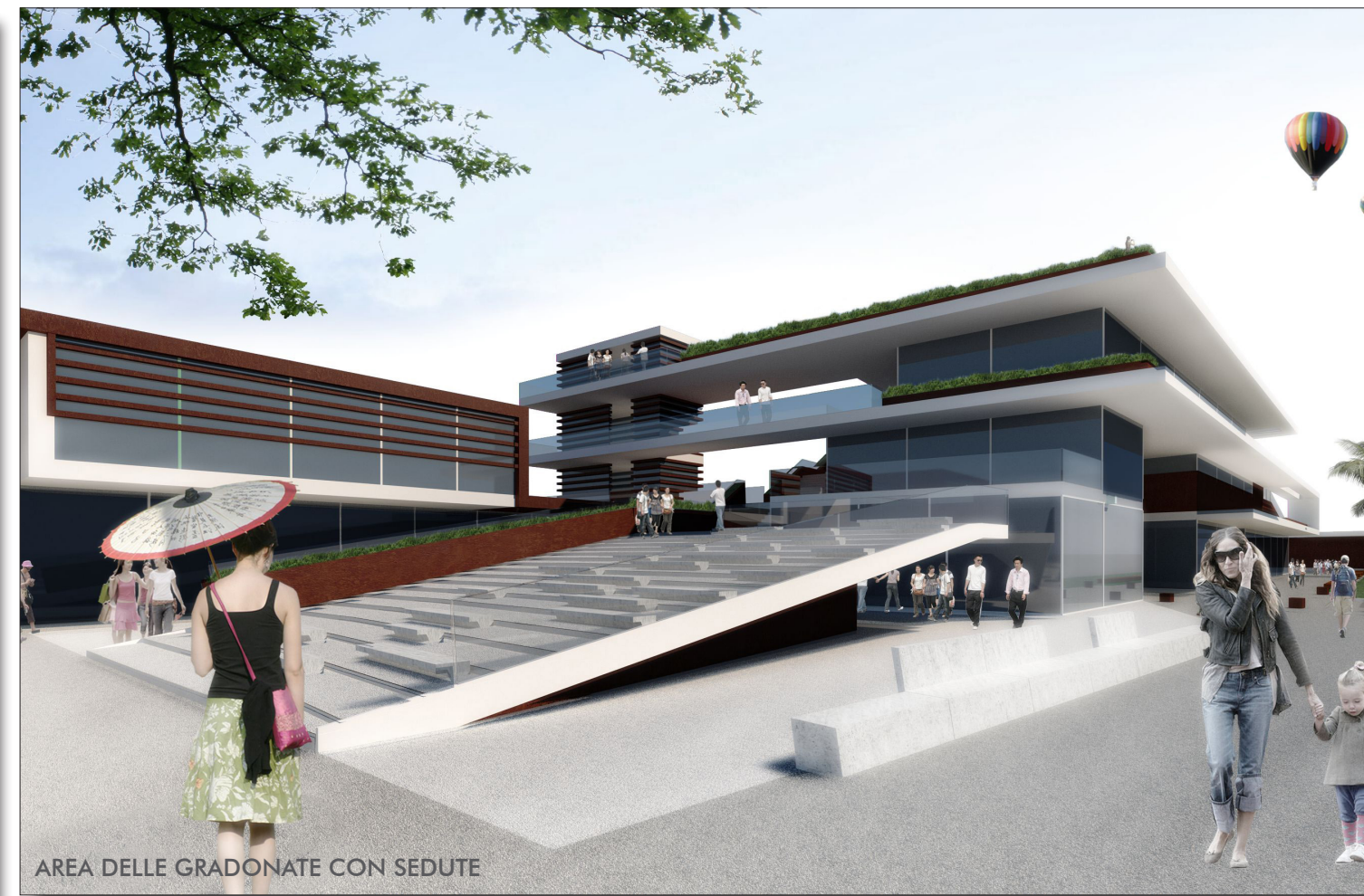
AREA DELLE GRADONATE CON SEDUTE