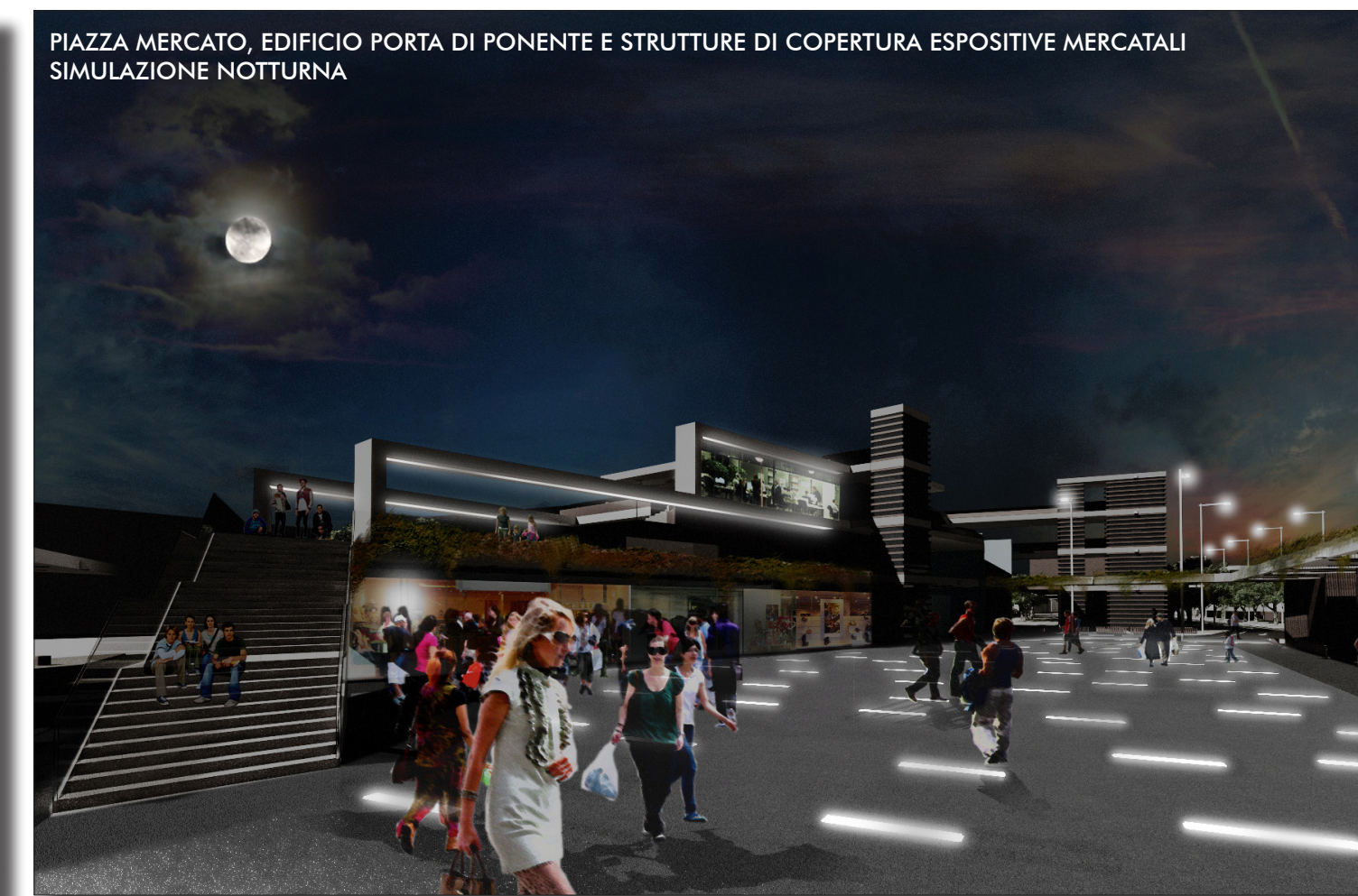
PIAZZA MERCATO, EDIFICIO PORTA DI PONENTE E STRUTTURE DI COPERTURA ESPOSITIVE MERCATALI SIMULAZIONE NOTTURNA