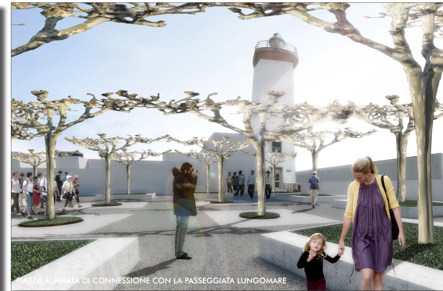
PIAZZA ALBERATA DI CONNESSIONE CON LA PASSEGGIATA LUNGOMARE