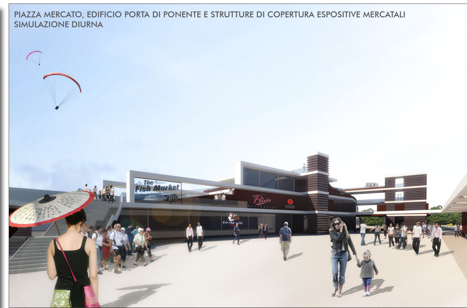
PIAZZA MERCATO, EDIFICIO PORTA DI PONENTE E STRUTTURE DI COPERTURA ESPOSITIVE MERCATALI SIMULAZIONE DIURNA