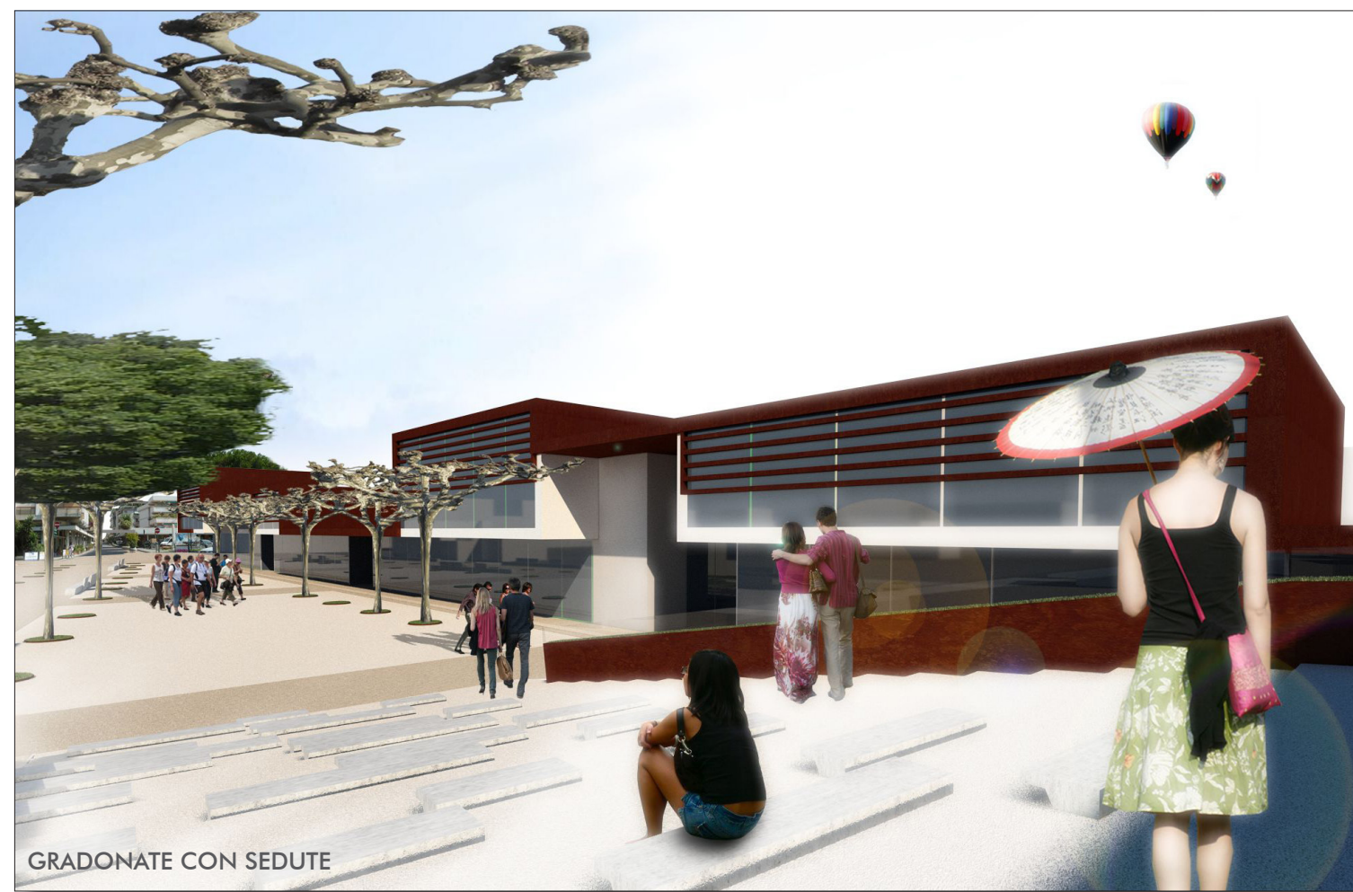
GRADONATE CON SEDUTE