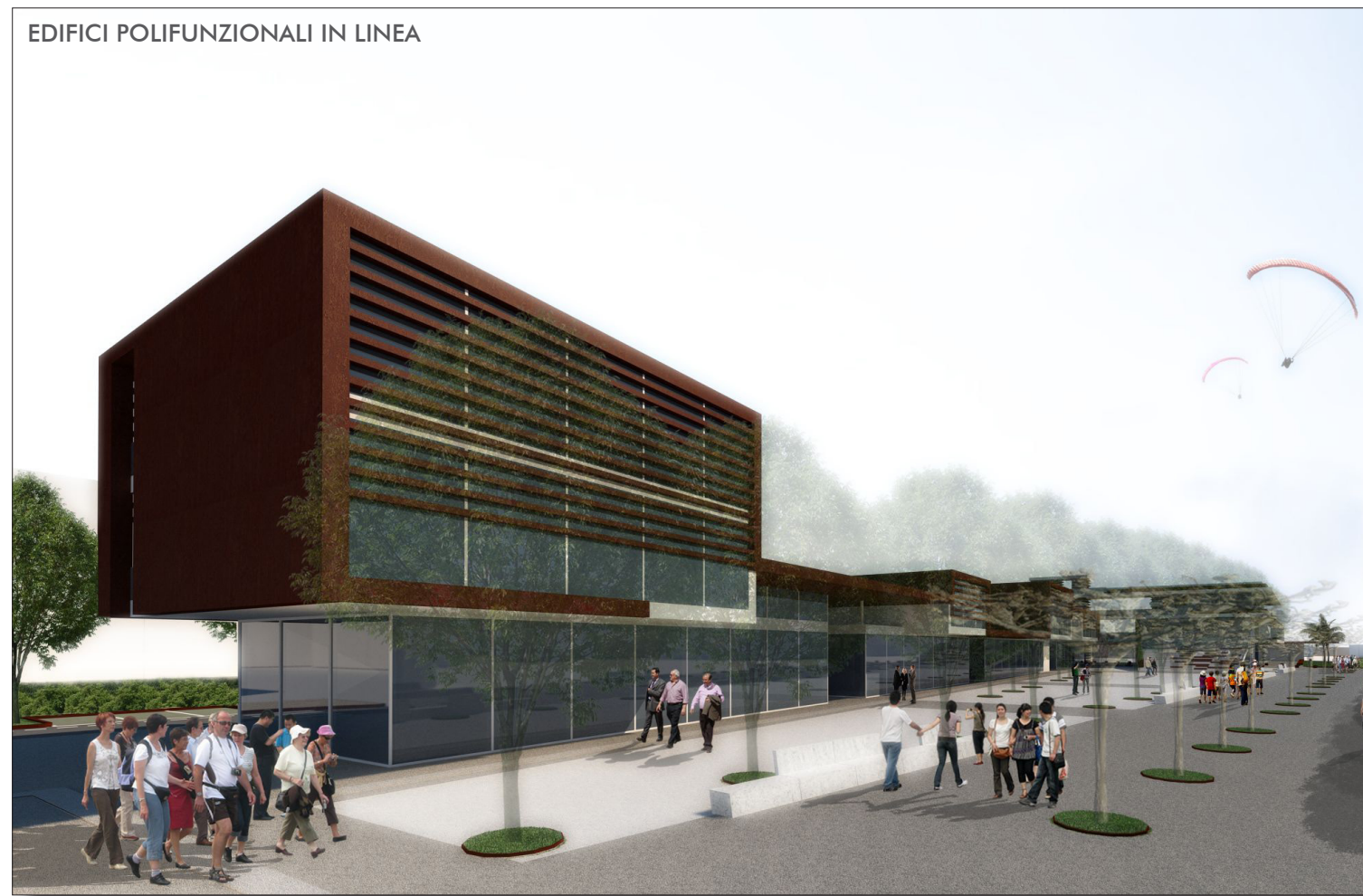
EDIFICI POLIFUNZIONALI IN LINEA