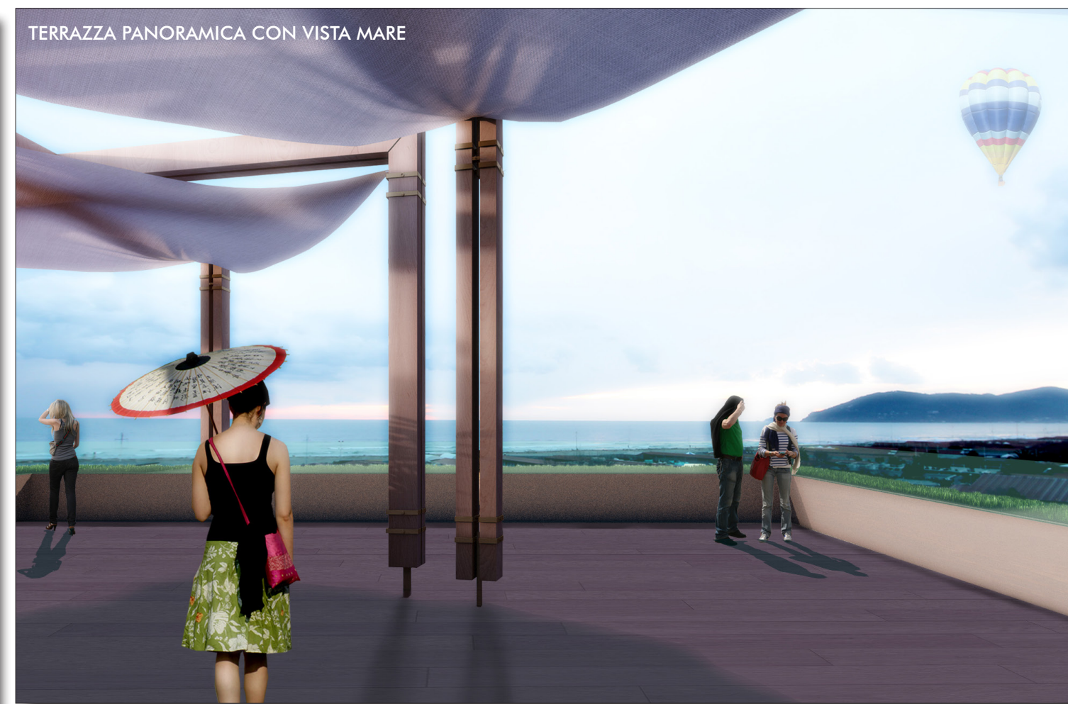
TERRAZZA PANORAMICA CON VISTA MARE